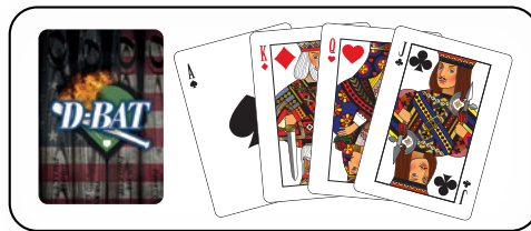
Personnalisation 1 côté

Peuvent être commandés en multiple de 25 seulement.