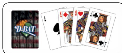
Personnalisation 1 côté