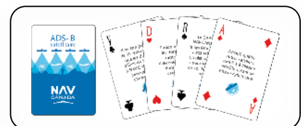
Personnalisation 2 côtés